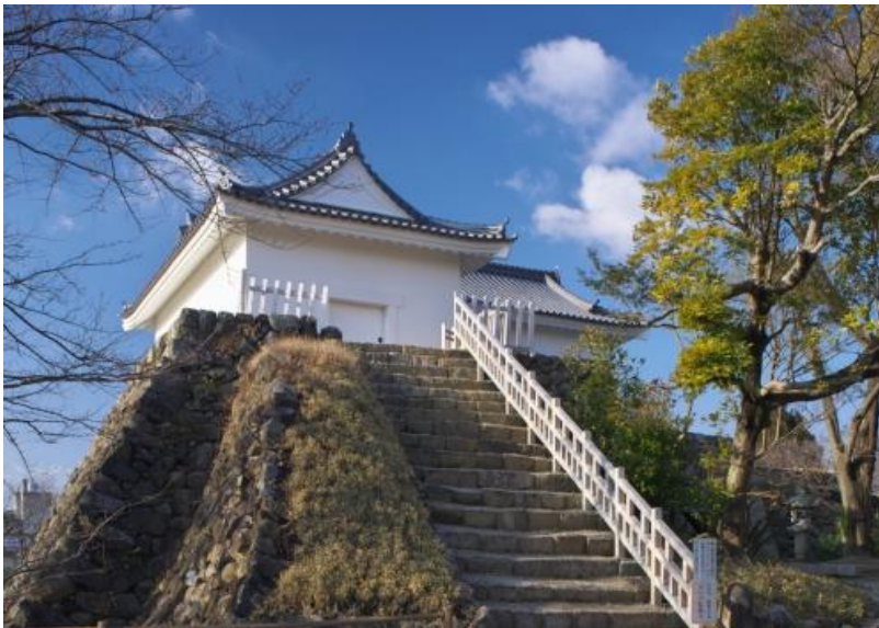
《 新外観 》