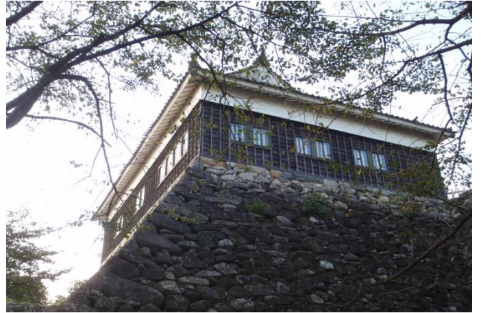
《 旧外観 》