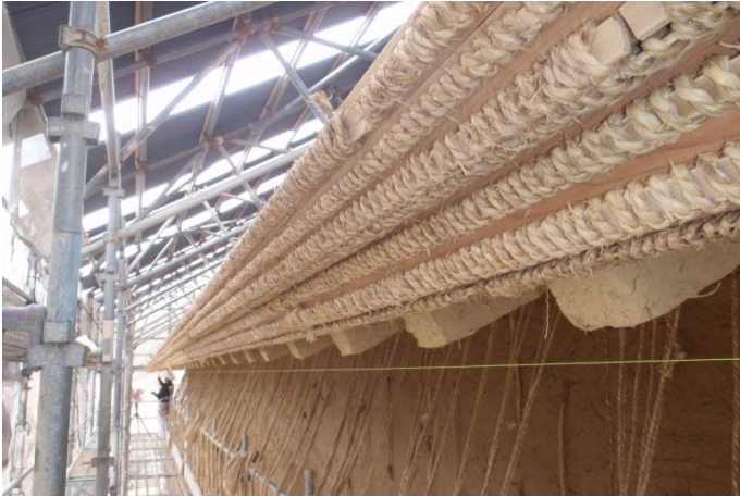
《 左官工事 》

平成19年4月15日に三重県中部で地震が発生し、その際石垣の一部が崩落する被害を受けました。地震発生以降、崩れた石垣の修復とともに、多門櫓の復原修理に取り組んできました。平成23年8月から1年半かけて進めてきた復原工事が平成13年1月に無事終わりました。