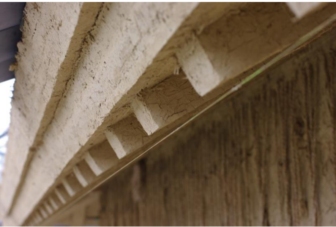
《 左官工事 》