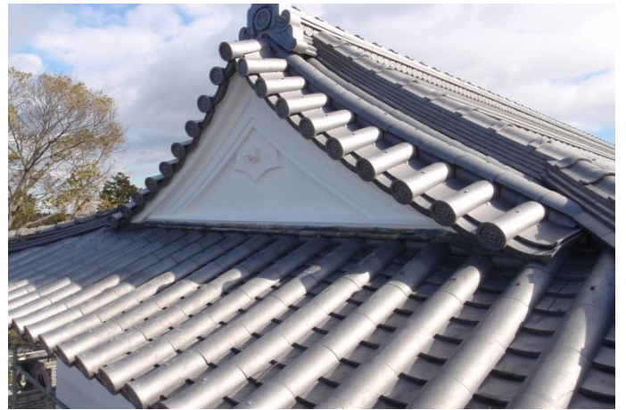
《 屋根 》