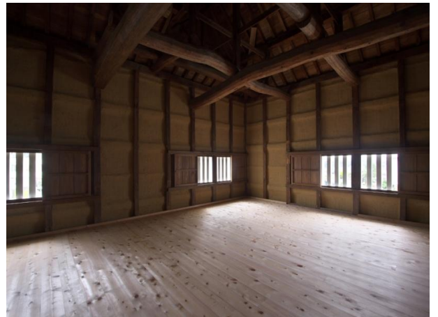
《 内観 》