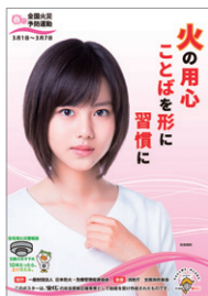
平成30年 春季全国火災予防運動ポスター