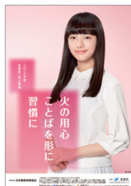
平成29年度 全国統一防火標語ポスター

この火災予防運動にあわせて、山火事予防に対する意識を高め、森林の保全と地域の安全に資することを目的とした「全国山火事予防運動」を林野庁と共同で実施します。