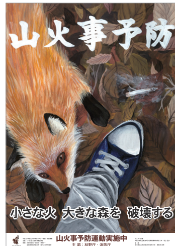
「全国山火事予防運動」ポスター